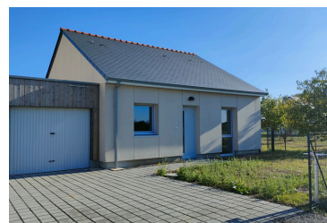
Meldomys 7 pavillons (49)