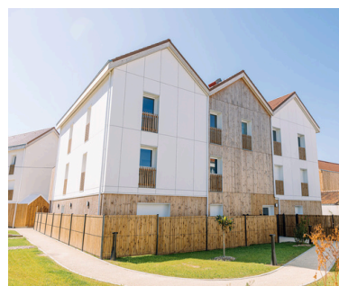
Eden Promotion Olonne (85)