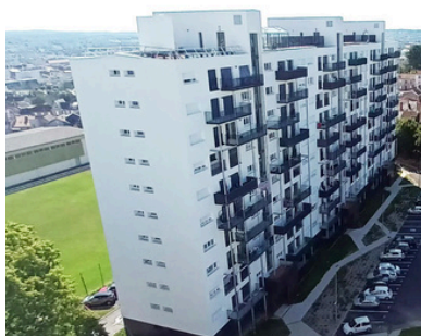
La Nantaise d'Habitations Le Dolmen (44)