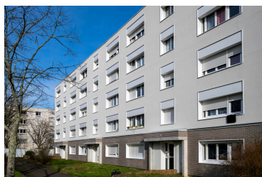
Nantes Métropole Habitat Villes du Canada (44)