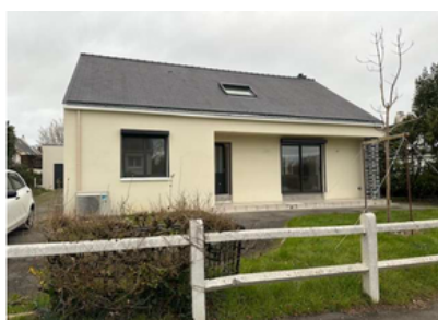
NRGYS Maison individuelle (44)